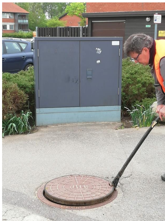
Figur 1: Nødforsyning ved Højstrupparken